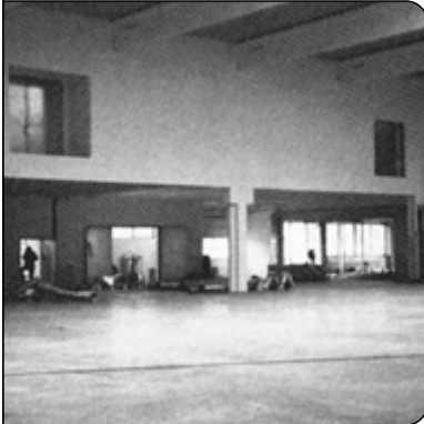
Blick in die Lagerhalle