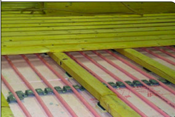
Einblick in den Schwingboden

Die MULTIBETON-Fußbodenheizung unter Sportböden garantiert für eine gleichmäßige Wärmeabgabe über die Gesamtfläche der Halle und sorgt so für ein gleichmäßiges und optimales Temperaturniveau. In der Turnhalle der Volksschule von St. Marein im Mürztal wurde 1998 ein MB-Schwingboden installiert.