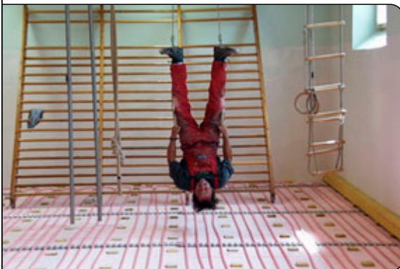
Spaß bei der Verlegung mit MULTIBETON